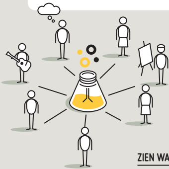
ZIEN WAT DE PROJECTLEIDER DIENSTVERLENING VAN DE SAMENWERKING MET STADSLAB0495 VINDT?